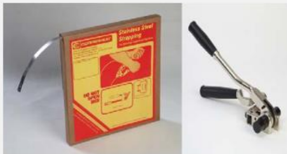
Trake, spojnice i natezači trake