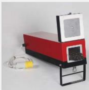
Sušenje elektroda do 300°C -110V