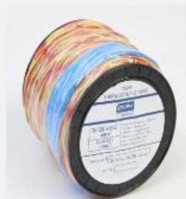
Termo par žica