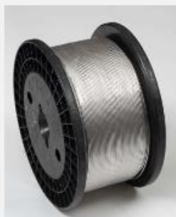
Žica za grejače