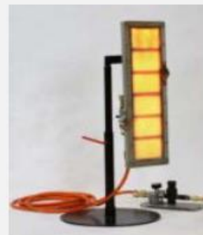
Grejači na gas

Za sva pitanja i zahteve možete nas kontaktirati na office@vecowelding.com ili na tel. 0631669646.